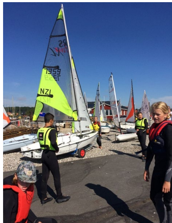
Skippermøde med afstand

I jolleafdelingen er der plads til alle og vi hjælper hinanden